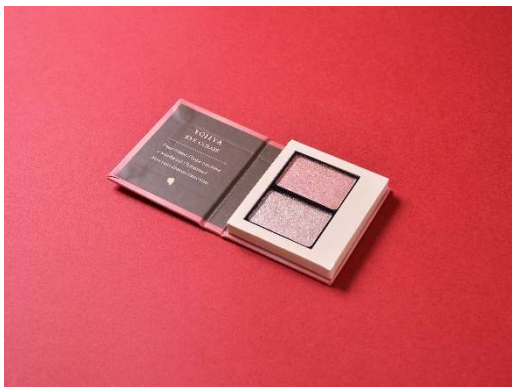
*アイカラーパレット 石竹色・星明色 <コフレ限定アイテム>

今回クリスマスコフレのためだけに限定のキャンドルとアイカラーパレットを作りました。キャンドルは「はなほのか」シリーズの上品で華やかなフルーティフローラルの香り。やさしいピンク色で、火を灯すと「はなほのか」の香りが部屋いっぱいに広がります。アイカラーパレットは肌なじみのいいピンクカラーの石竹色と目元を華やかにする星明色の2色入り。重ね塗りはもちろん、それぞれ単色としてもお使いいただけます。