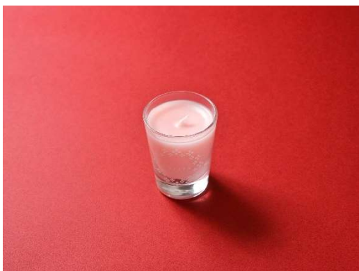
*はなほのかアロマキャンドル <コフレ限定アイテム>

「石竹色」は、繊細なパールが入った肌なじみのいいピンクカラー。「星明色」は目元を華やかに魅せるグリッター。単色使いとしてはもちろん、重ねてつけても使いやすいパレットです。